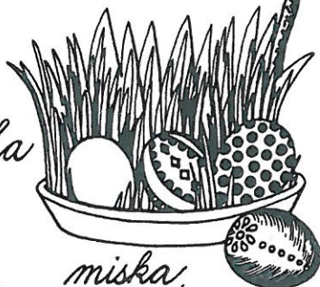
miska s osením a vajíčky